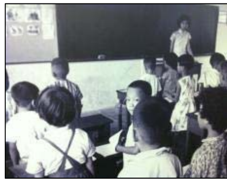
展館照片所見學生於天台小學及簡陋課室上課的情況

從展館照片及展品所反映的屋邨居民日常生活，未必如居住環境單位內的實物擺設般那麼具體地展示當時情況，但仍可作為了解香港居民生活素質變化的參考資料。然而由於展品以相片為主，故學生在參觀之後要多利用文獻輔助，才可以有較為全面的認識。