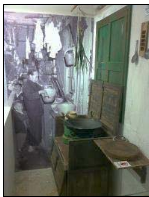
居民在戶外走廊煮食

美荷樓屬「H型」公共房屋，大廈中座是公共浴廁及洗滌的地方，而在兩側長形雙翼之間所形成的兩個天井，是居民的主要活動場所，用作休憩納涼之處。整座大廈共有四條位於首尾兩方的樓梯，居民往來都需要途經鄰居家門。而且由於單位面積狹小，居民經常利用走廊擺放雜物，並在走廊設置廚櫃生火煮食，夏天晚上更會搬出帆布床在走廊睡覺 12 。這種建築特色，毋庸諱言會對居民生活帶來頗多不便；而共用公共衛生設施，就更可能引起居民之間的磨擦和爭執。然而另一方面，這些建築特色促進住戶之間的接觸和了解，有助培養鄰里關係。同時亦由於最初搬進石硤尾邨的居民，大部分都是石硤尾火災的災民，這些共同經歷，亦令大家長久維繫睦鄰網絡。以下為一些居民的回憶片段：