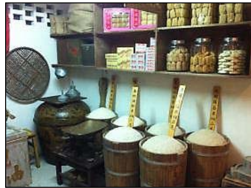
設計成雜貨店形式的展覽單位

現時無論是公共屋邨還是私人樓宇附近，都會有大型超級市場及廿四小時營業的便利店，方便居民購買日常用品及食物。然而當這些超級市場及便利店在數十年前尚未成行成市的時候，屋邨居民平日購物的地方，多為開設於邨內的雜貨店及士多。這類店鋪於今天除了在樓齡較長的公共屋邨，或是新界部分舊式墟市外，於市區已難得一見。而在「美荷樓生活館」的一樓展廳，有一個單位即設計成當年的雜貨店模樣，學生可藉此認識以往店鋪的經營情況，並可以對居民生活的影響為焦點，從不同方面（例如購物環境、便利程度、貨物種類、店員與顧客的關係）比較這些店鋪和超級市場或便利店的分別。