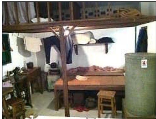
1950年代落成初期的公屋單位

貧窮生活，似乎注定如此。晚上一家八口睡在兩張碌架床，……（父母）要睡覺，得把竹蓆鋪在地板，明天一早起床就把竹蓆捲好，騰出吃飯、做功課和家庭手工業的地方。……床板上常有木蟲，咬得人痕癢難耐。……還有老鼠，晚上睡覺，不時會給老鼠咬醒 5 。