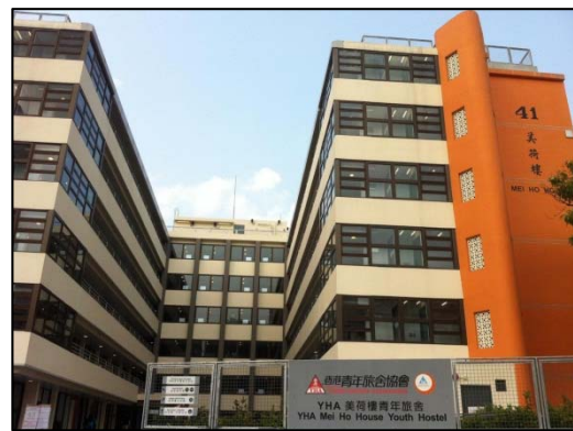
重建為青年旅舍的美荷樓