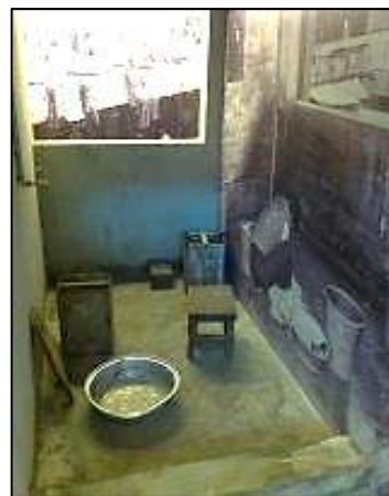
廁所旁邊的公共洗滌空間

每個人上廁所都必須走一大段路到該層的公共廁所，男廁只有三格，污穢不堪，即使大清早前往，廁坑之上早就佈滿金銀糞土。……有時遇到繁忙