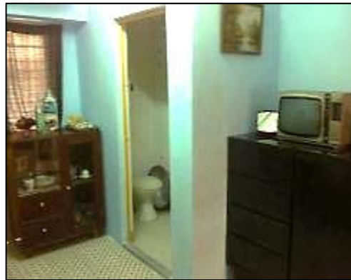
1970年代重建後的公屋單位

美荷樓落成初期，各單位均沒有獨立廚廁，居民需要在單位外的走廊生火煮食，以及使用數目不足、衛生環境惡劣及治安欠佳的公共浴廁。以下兩名居民憶述上廁所及到浴室洗澡的情況，恐非現時大部分學生可以想像：