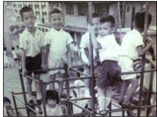
展館照片所見的兒童於屋邨公眾地方玩樂的情況

上世紀中期，草根階層子弟接受教育的機會有限，即使能夠入學，學習環境及條件亦欠理想。展館內有屋邨天台小學，以及在設施簡陋課室上課的相片，可以反映當年的教育情況。然而這種外在困難及挑戰，無礙當時的學童力求上進，爭取出人頭地的機會 9 ，可視為知識改變命運的典型例子。學生可從這些相片或回憶文字當中，認識香港教育的發展歷程，並以求學機會及學習環境為重點，了解教育機會對於提升香港人生活素質的影響。