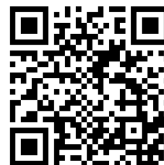
「 古蹟活化 」影片