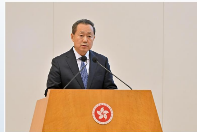
*中央人民政府駐香港特別行政區維護國家安全公署署長

董經緯*致辭時指出，中央政府發布《白皮書》意義重大。適逢「十五五」開局之年、香港由治及興邁出新步伐關鍵之年，適逢香港最具標誌性的國安案件——黎智英案依法定罪判刑歷史節點，展示了以習近平同志為核心的黨中央全面準確、堅定不移貫徹「一國兩制」方針的重大成果，展現了香港從由亂到治走向由治及興新階段的光明前景。香港維護國家安全的鬥爭從未停止，中央政府在香港問題上始終將維護國家安全擺在重要位置。有了安全的護航，「一國兩制」得以堅持和完善，必將繼續行穩致遠。駐港國家安全公署將一如既往堅定依法履職，踐行國安法治，切實發揮職能作用，全力支持香港特區全面準確實施香港國安法律，堅決防範打擊外部勢力干擾破壞，與特區各界同心攜手、並肩而行，共同守護國家安全、守護香港穩定、守護市民福祉，奮力續寫「一國兩制」成功實踐新的篇章！