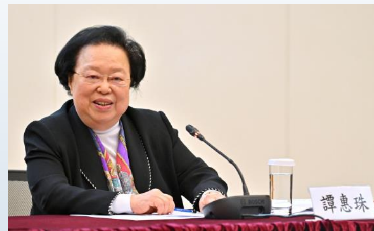
*全國人民代表大會常務委員會香港特別行政區基本法委員會原副主任譚惠珠博士