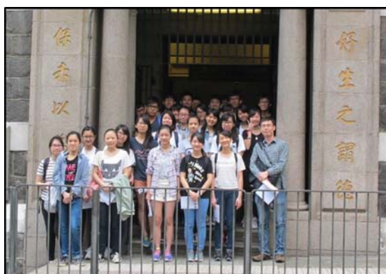
考察地點：舊贊育醫院

高中通識教育科自實施以來，教師在學與教和評估方面累積了不少成果可供參考，故下文分享其他環節的經驗，介紹本校於 2016 年 5 月帶領學生前往上環及西環，考察歷史建築的活化情況，說明怎樣藉着考察活動以配合課堂教學，讓學生更深入掌握知識和概念，並在增廣見聞之餘，同時有助撰寫獨立專題探究。