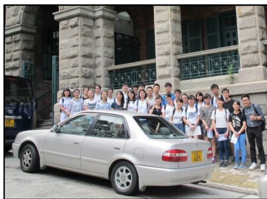
考察地點：舊高街精神病院

在介紹本校經驗之前，或許同工會有疑問：「既然已有大量網絡資源可供通識教育科作為教材，還有需要勞師動眾帶領學生外出考察嗎？」根據我的觀察，不少時下年青人固然精於使用資訊科技，但這反而令他們缺乏親歷其境的機會。很多學生除了居住地區和區外某些著名地標，就甚少踏足生活圈子以外地方，故在上課回應教師所問，又或是作答題目時，往往內容單調，而且例證不足。舉辦戶外考察活動，正可擴闊學生視野，又能加強他們的反思能力。