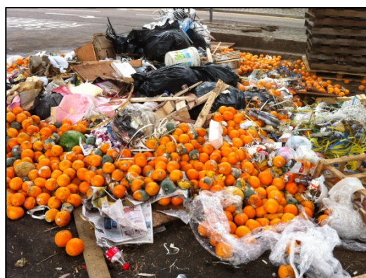
卸貨後棄置在路旁的腐爛水果

油麻地果欄位於九龍市區心臟地帶，而且其運作亦對附近居民帶來影響，政府多年來都有與果欄商會（九龍果菜同業商會）商議搬遷果欄的事宜，期望騰出土地作其他發展用途，而其中一項建議為搬遷至長沙灣副食品批發市場第二期。果欄商會表示若搬遷後香港全部的鮮果批發都集中在新市場進行，則願意搬遷，惟政府以不宜干預市場運作模式為理由而拒絕，至今雙方仍未有共識 16 。