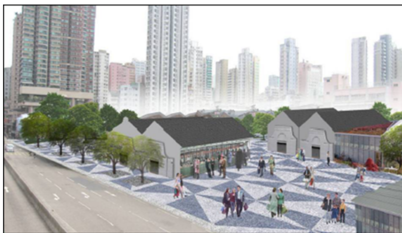
概念 1：油麻地果欄作低密度發展及提供足夠的綠化公共空間

二為「果欄作地道文化培育、展覽、表演的後勤基地」（詳見以下兩幅「優化示意圖」） 17 。此外，在區議會內亦成立了「關注油麻地果欄工作小組」，以跟進並促請政府盡快處理 18 。