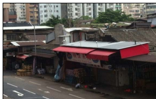
油麻地果欄的外貌