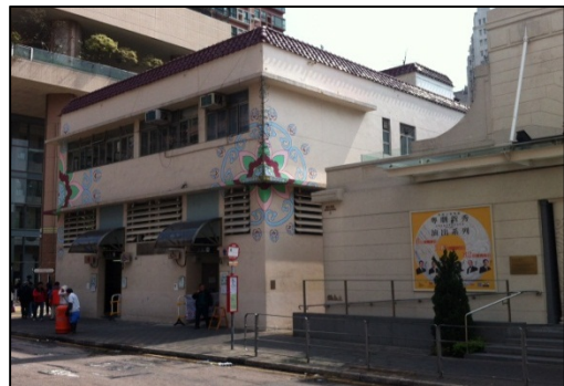
戲院與垃圾收集站及露宿者之家毗鄰