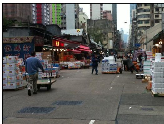
約上午八時油麻地果欄的運貨及卸貨情況

果欄建築具多重價值，例如在歷史層面可見證本地食品貿易的發展；在文化及美學層面是一個「活」的香港文物，是「本土建築」的代表；至於社會層面則是一個世紀以來的水果貿易心臟地區 12 。2013年為果欄建成一百週年，坊間頗多介紹果欄的文章及人物專訪，不約而同地提及其歷史價值及濃厚的人情味 13 。然而果欄存在於油麻地社區，卻對該區居民生活帶來不便，對社區衛生環境亦有一定影響。例如交通方面，果商在路邊卸貨，引起交通擠塞，並影響行人及駕駛者安全，更曾發生致命交通意外 14 ；噪音方面，果欄的工作時間以凌晨最繁忙，運貨與卸貨的噪音對就寢的居民頗為滋擾；衛生方面，腐爛的水果經常被搬運工人或購買水果的人士棄置路旁，發出臭味及易令滋生蚊蟲 15 。