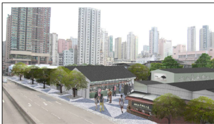
概念 2：油麻地果欄作地道文化培育、展覽、表演的後勤基地

誠如上文所言，搬遷油麻地果欄，主要涉及果欄經營者與工人、油麻地區居民、油尖旺區議會、政府相關部門（例如民政事務局、食物及衛生局）等持份者的利益。學生前往考察時，宜留意以下重點：