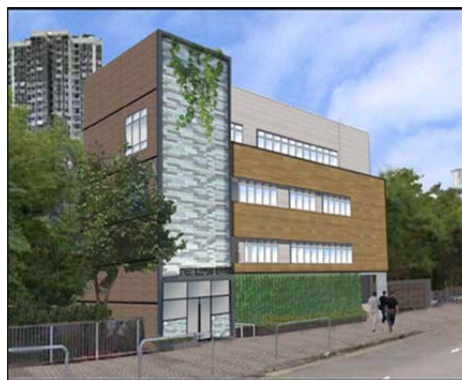
擬重置的露宿者之家及垃圾收集站建成後的構想圖

油麻地露宿者之家位於上海街 345 號 A 二樓，而地下則為上海街臨時垃圾收集站，並毗鄰已活化為戲曲中心的油麻地戲院。政府及粵劇界都希望擴建油麻地戲院，以增加演出場地，從而促進粵劇的發展。而要騰出空間擴建油麻地戲院，則需要另覓地方重置露宿者之家及垃圾收集站。政府建議將兩者重置在同區巧翔街同一幢大廈，並會美化建築物的外觀及明顯分隔兩者的出入口，而垃圾收集站的空氣亦會經過強化的除臭及過濾系統處理 2 。