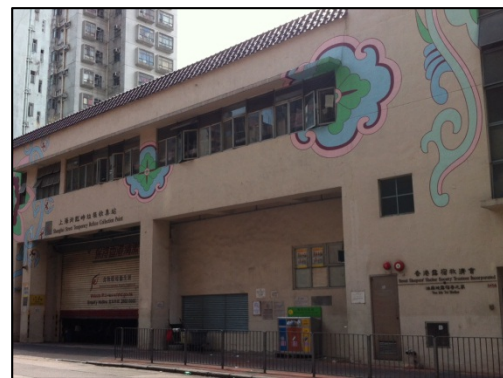
油麻地露宿者之家及臨時垃圾收集站外貌