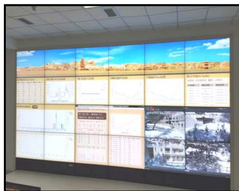
利用科技監察文物情況