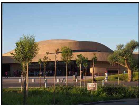
莫高窟「數字展示中心」

為了保護敦煌文物，並讓來自中國以至世界各地的遊客，都可以認識這座藝術寶庫，中國在文物保育方面做了大量工作，其中尤以利用科學化數據及科技協助管理，取得重大成效。由敦煌研究院興建的「莫高窟數字展示中心」於 2014 年投入使用，遊客在進入洞窟實地參觀前，首先在展示中心內從多媒體數碼球幕影院觀看壁畫，讓遊客認識洞內情況，繼而再進入洞窟參觀，並且嚴格控制參觀人數，以免令莫高窟超出承載能力。另一方面，濕氣和二氧化碳會對壁畫岩體產生氧化作用，加速莫高窟衰老；因此每個洞窟均設有監測儀器，把不同的環境數據即時傳送到「洞窟調控中心」，若發現個別洞窟超標，例如二氧化碳升高、濕度上升、溫度增加，就會關閉洞窟，暫停參觀，以保護洞窟內的壁畫和彩塑。大家在通識教育科課堂處理文物保育議題時，可以向學生介紹這種「先參觀展示中心，再前往實體洞窟體驗」的參觀模式 1 ，引導他們探究科學科技如何有助文物保育工作，以及這種參觀方式是否可以推廣至內地和香港的其他文化遺產場地。