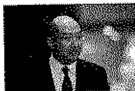
▲首任行政長官及首任副行政長官分別為(左一)和(左二)在用人政策上堅持「港人治港」原則，分別就政了香港大和香港國際，辦理「港人治港」的條例。