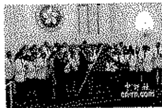
▲倫敦 2012 奧林匹克運動會中香港運動員在賽場上揮舞香港旗幟，會上香港體育協會、香港賽馬會等社團代表及香港各界代表均到場祝賀香港隊手，祝賀香港隊取得好成績。

《基本法》規定香港實行「高度自治」，享有行政管理權、立法權及獨立的司法權和終審權。除了外交和防務由中央政府負責外，香港政府有權處理所有區內事務。此外，中央政府亦授權香港自行處理某些對外事務，例如可以用「中國香港」的名義參與「世界貿易組織」和「奧林匹克運動會」等。