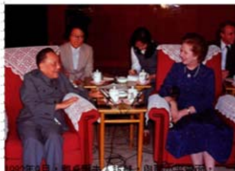
1982年9月，鄧小平與夫人訪華，與撒切爾夫人會面，談香港前途問題。 42

但由於中國政府的堅定立場，即使好像英方所宣稱的三條條約繼續有效，新界也要在1997年7月1日歸還中國。若兩國不談判，沒有新界的香港島及九龍是難以自己生存下去的，因此英國只好同意與中國就香港的前途問題談判。 41