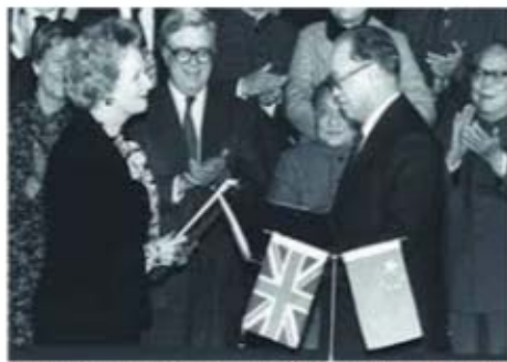
1984年12月中英兩國在北京簽署《中英聯合聲明》。 44

從1982年9月開始，中、英兩國經過兩年多的談判，終於在1984年12月19日由中國總理趙紫陽與英國首相戴卓爾夫人在北京就香港前途問題正式簽署了《中華人民共和國政府和大不列顛及北愛爾蘭聯合王國政府關於香港問題的聯合聲明》。（簡稱《中英聯合聲明》）。 43