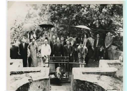
東華三院貫徹先賢「慎終追遠」的宗旨，每年均會派員到義塚祭祀先友。