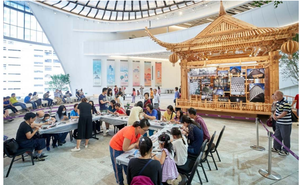
西九戲曲中心工作坊