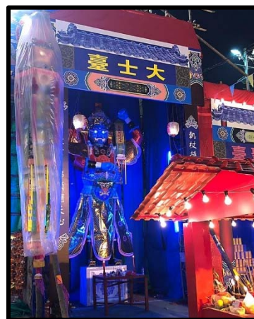
相片乙：盂蘭勝會其中一座祭壇*

*神功戲既是供神明觀賞，也是為了娛樂街坊，藉以令神明開心，讓未來一年大家得保平安。